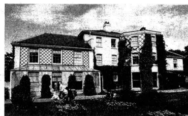
ダーウィンが過ごした「ダウンハウス」

研究を支えたのが、手紙による情報収集だった。鈴木准教授によれば、研究者に手紙を書き、アカデミックな交流を続けたという。鈴木准教授は「ダーウィンは丁寧に相手をおだてたり、相手のプライドをくすぐ